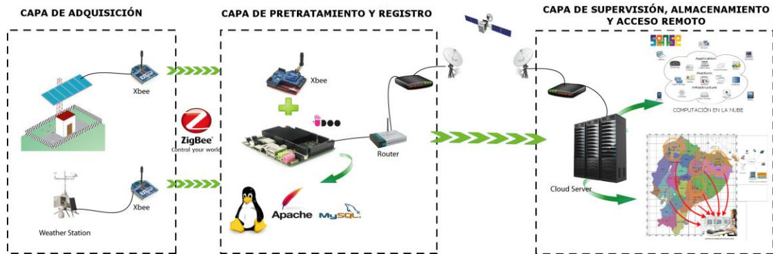
Figura 4. Propuesta de Una Nueva Arquitectura para el Monitoreo Remoto de Estaciones Fotovoltaicas Aisladas en el Ecuador Basado En IoT Y Cloud Computing