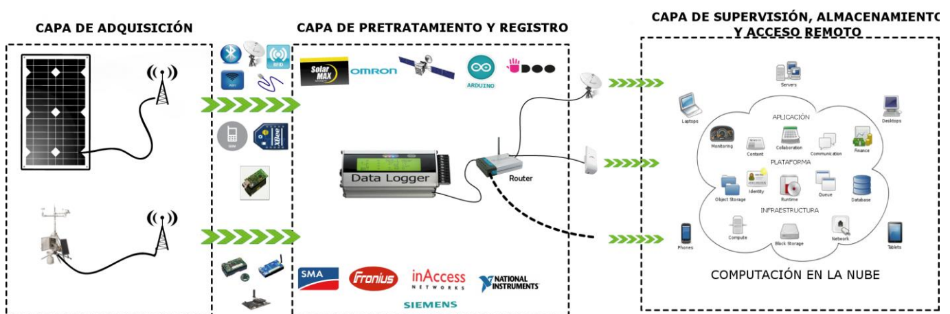
Figura 2: Arquitectura moderna de los sistemas de monitoreo remoto.

La arquitectura moderna de un sistema de monitoreo remoto se divide en tres capas, Fig. 2: La capa de adquisición, la capa de pre-tratamiento y de grabación y la capa de almacenamiento y Servicios Web.